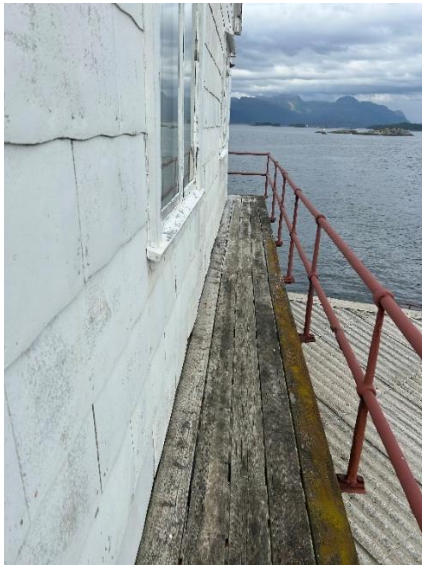
Fasadeplater og gangveg

Alt listverk på alle vinduer og dører utvendig der det er eternitt skal demonteres og saneres. Eternittplater skal demonteres og saneres ihht gjeldende regelverk.