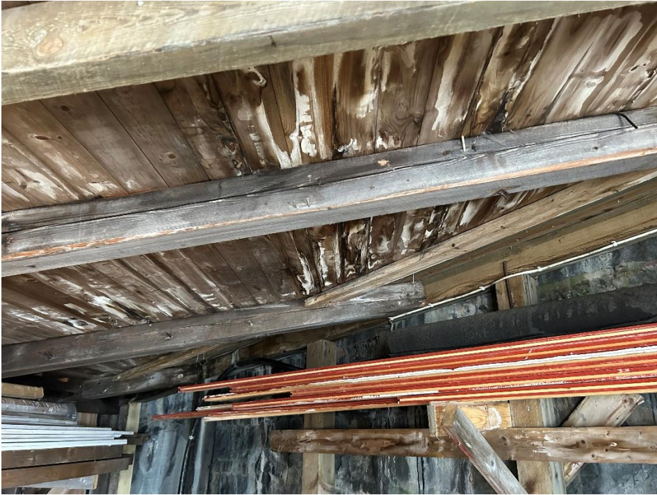
Tak inne i sjøhuset.